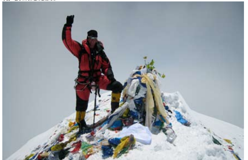
李奥·霍丁在珠峰巅峰